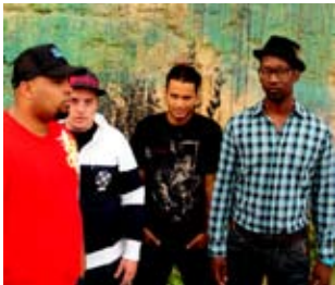
Buraka Som Sistema